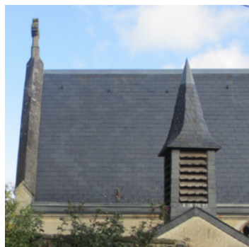
Couverture en ardoise