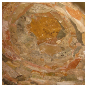
Couverture en lave vue de l'intérieur