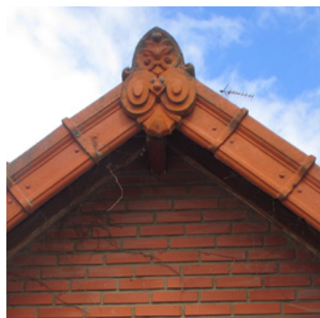
Tuiles de rives