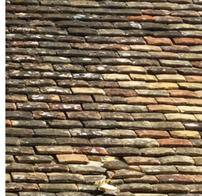
Couverture de tuile plate

Les ardoises sont surtout utilisées dans le Morvan et pour des ouvrages patrimoniaux. Rectangulaires, elles sont posées au crochet sur un voligeage en bois et présentent une épaisseur très fine.