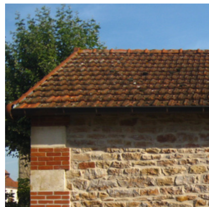
Couverture en tuile mécanique