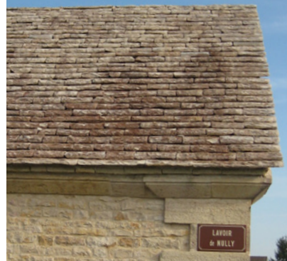
Réhabilitation de qualité d'un toit en lave

Les solins assurent l'étanchéité entre une couverture et un mur (ou une souche de cheminée). Le gel et le dégel les fragilisent. Le solin doit être exécuté avant l'enduit de finition. Exclure tout joint en silicone.