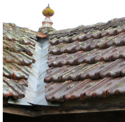
Noue en zinc