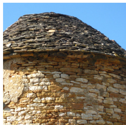
Couverture en lave

Des points sensibles de la couverture seront à prendre en compte :